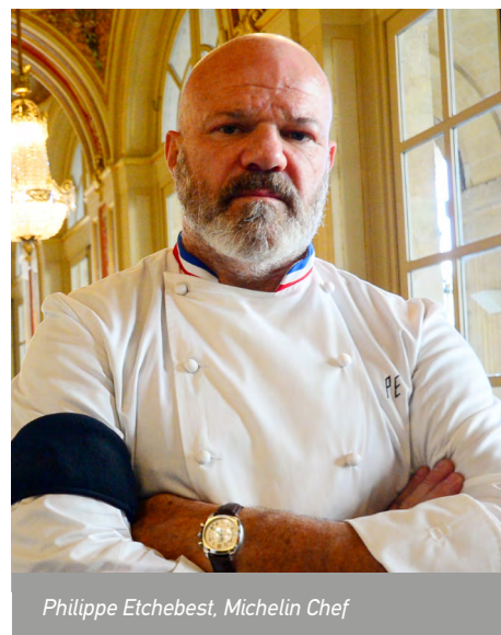
Philippe Etchebest, Michelin Chef